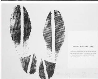
D. Oppenheim Ground mutations, 1969