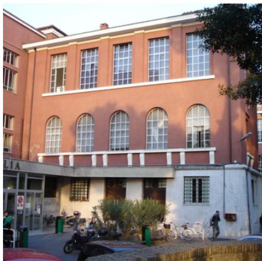
Dove: Via Gramsci 53