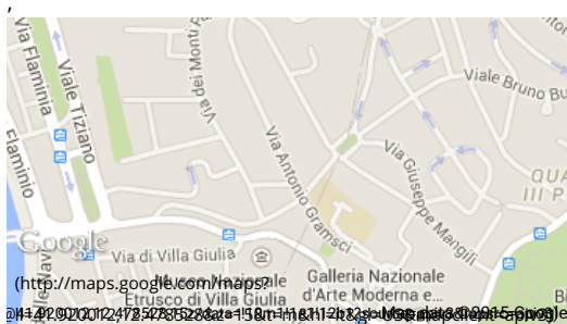
Come arrivare in Tram: 2 / 3 / 19 Come arrivare in Bus: 982 / 52